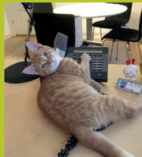
Spiky passer tjenesten!