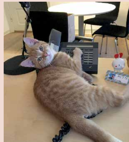
Spiky passer tjenesten!