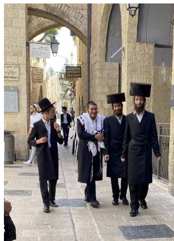
Ortodokse jøder fejrer nytår.