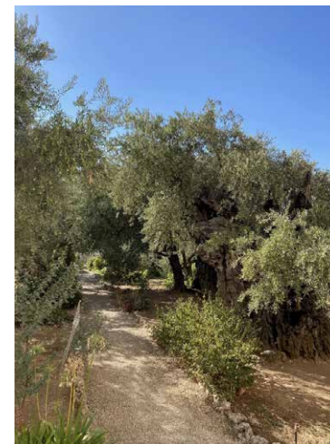
Getsemane have på Oliebjerg.

Ved siden af Getsemane have ligger endnu en Barluzzi kirke, der hedder 'Alle Nationers Kirke'. Udover en indgangsdør, der kunne ligne 'livets træ' fra syndefaldsfortællingen, men nok snarere skal forestille et oliventræ, i og med at kirken ligger hvor den gør, så har kirken også det mest fantastiske knæfald. Dette er nemlig udformet som en tornekrans. Helt anderledes i sin indretning – og da heller ikke en af Barluzzis kirker - var Marias gravkirke. Bag kirkens alter var der et lille rum, hvor den hellige moder var stedt til hvile. Inden man gik ind i dette rum, var der et omvendt Madonna-billede, hvor det ikke var Maria, der sad med sin døde søn i armene, men hvor det var Jesus, der hentede sin døde mors sjæl. I øvrigt er dronning Bodil også begravet i kirken. Hun var gift med Kong Erik Ejegod, der drog på pilgrimsfærd til Jerusalem i 1103. Han nåede dog aldrig frem, men døde på Cypern. Hans dronning fortsatte rejsen til Det hellige Land, hvor hun siges at være død af sygdom på Oliebjerg.