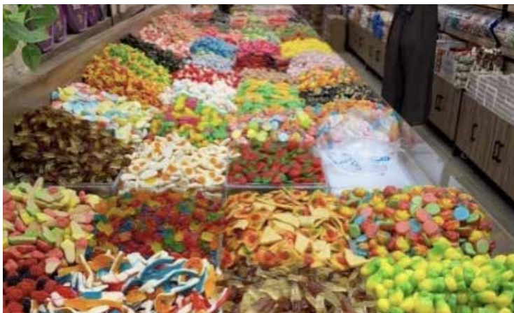
Et ægte 'slikparadis' i Basaren.

På trods af den anspændte stemning, fik vi både set Al Aqsa-moskeen (på afstand), Klippemoskeen (se billede), tempelpladsen og grædemuren (se billede). Særlig spændt var jeg, da vi ankom til Gravkirken, som er bygget på Golgata – altså det sted, hvor Jesus blev korsfæstet. Overrasket blev jeg, da jeg oplevede,