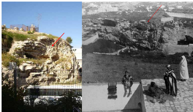
Fra gravhaven, hvor man kan ane kraniet i klippen.