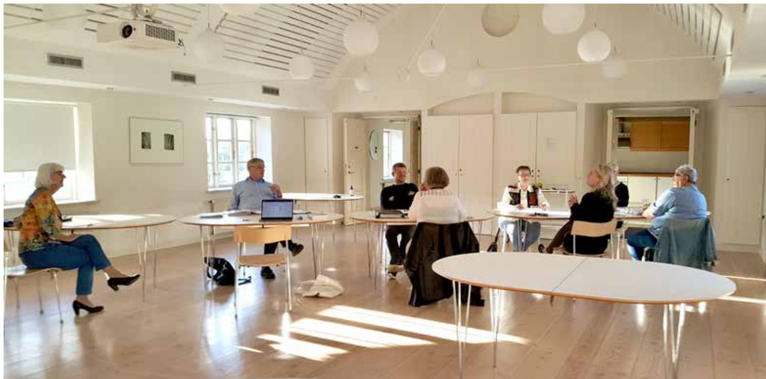
Møde i menighedsrådet med afstand og håndsprit.